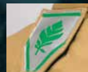
Arnés de Rescate DRD "Easy Grip"