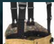
Sistema de tirantes ajustable "Black-Ops"

Cumple con la Norma NFPA 1971-2013 (ultima edición)